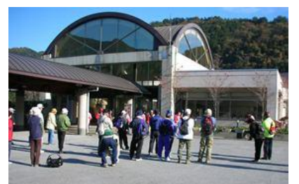
スタート・ゴール 寺尾公民館