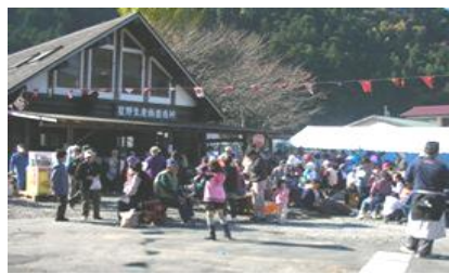
折り返し地点 星野休憩所